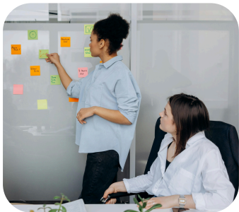
GÉRER LES RISQUES

Vous pourrez suivre cette formation sous statut scolaire ou en alternance (uniquement en 2ème année). Elle est axée sur 4 compétences qui assurent au jeune une poursuite d'études :