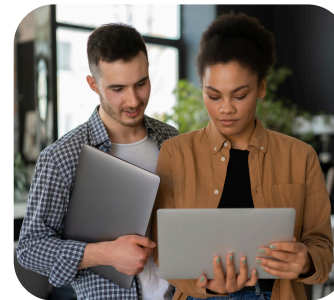
GÉRER LE PERSONNEL ET LES RESSOURCES