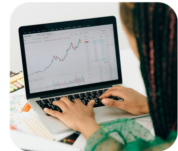
SOUTENIR LE FONCTIONNEMENT ET LE DÉVELOPPEMENT