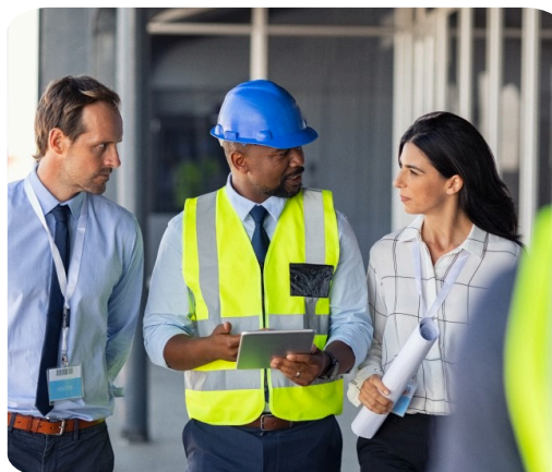
QSE (QUALITÉ - SÉCURITÉ - ENVIRONNEMENT)